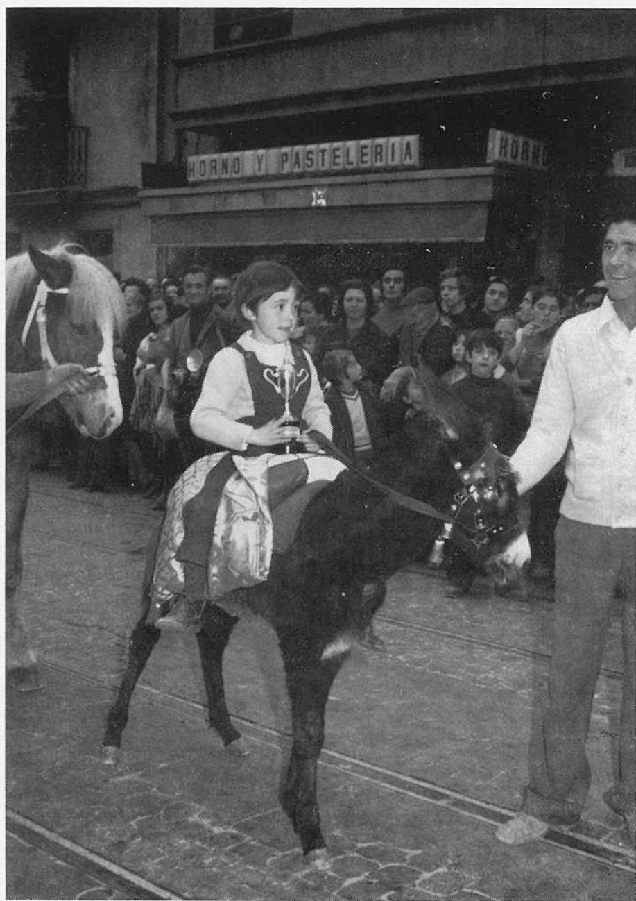
Una nota simpática de nuestra fiesta, la bendición de animales, que pone alegría y colorido en el homenaje al Santo.